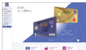
コーポレートサイト