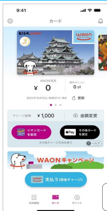
「WAON」アプリ トップ画面