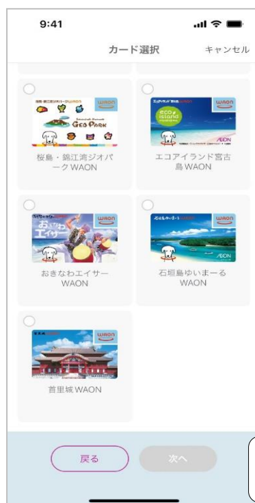
ご当地 WAON カード選択画面

イオンは、10月21日(木)よりイオンの電子マネー「WAON」(以下、「WAON」)を Apple Pay™でご利用いただけるサービスを開始いたします。