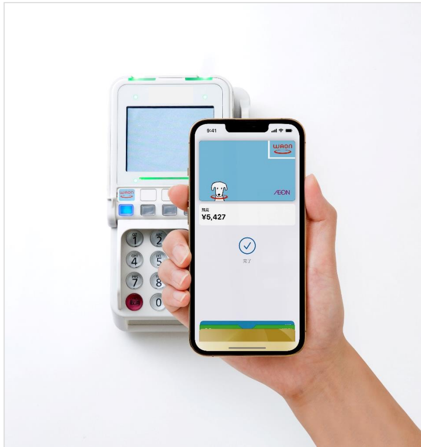
【参考画像：決済シーン】