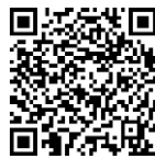
▲ iAEON ダウンロードはこちら