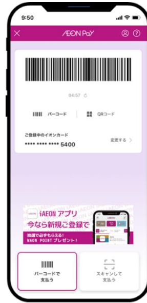
▲AEON Pay 決済画面