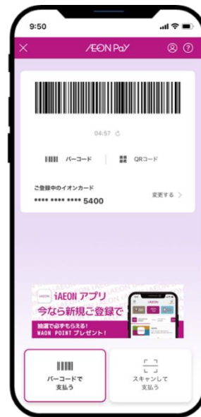
▲AEON Pay 決済画面