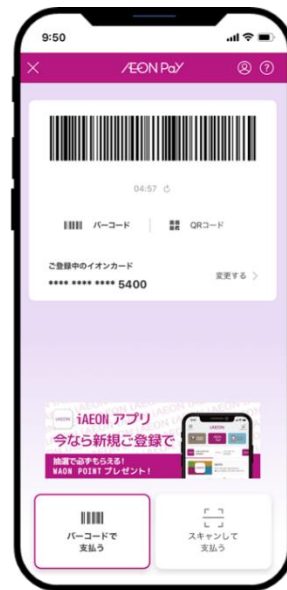
▲AEON Pay 決済画面