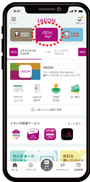
▲ iAEON アプリ画面