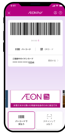
▲ iAEONアプリ画面 ▲イオンウォレットアプリ画面 ▲AEON Pay 決済画面

※1：「AEON Pay」はイオンのトータルアプリ「iAEON (アイイオン)」またはイオンカード公式アプリ「イオンウォレット」をダウンロードいただき、イオンマークのカードを登録することで利用可能となります。イオンのグループ店舗をはじめとした全国のAEON Pay 加盟店のレジにて、スマートフォンに表示されたコードを提示することで、簡単に決済することができます。