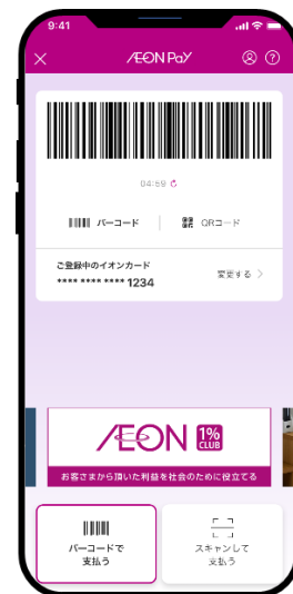
▲iAEONアプリ画面 ▲イオンウォレットアプリ画面 ▲AEON Pay 決済画面