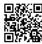
▲イオンウォレットダウンロードはこちら