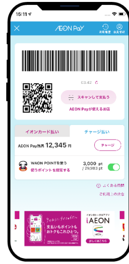
▲iAEONアプリ画面 ▲イオンウォレットアプリ画面 ▲AEON Pay 決済画面