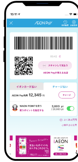
▲iAEONアプリ画面 ▲イオンウォレットアプリ画面 ▲AEON Pay 決済画面